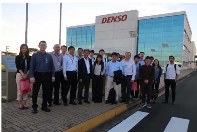
Fig.6 Denso do Brazil LTDA