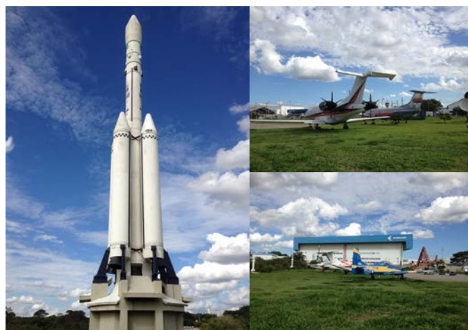
Fig.10 Brazilian Aerospace Memorial