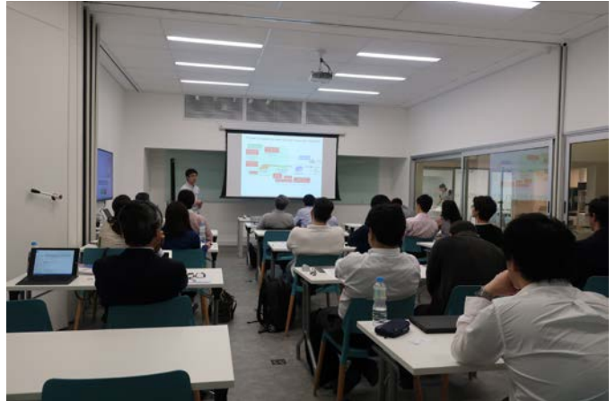
Fig.2 Students Workshop at University Sao Paulo