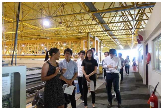
Fig.13 Oceano Basin (40m x 30m x 15m, central depth 25m)