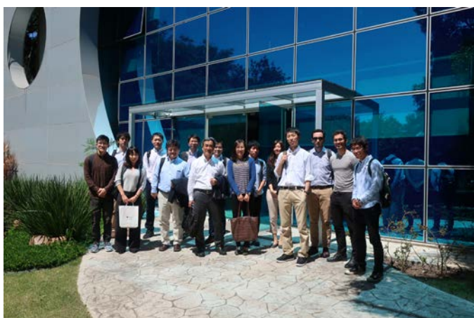
Fig.5 University Sao Paulo Lab. visit