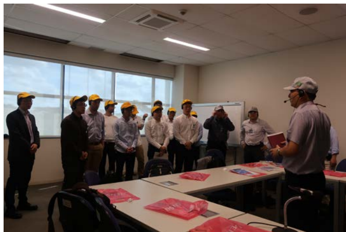
Fig.6 Denso do Brazil Factory visit