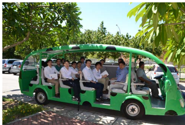
Fig.12 UFRJ Science Park Tour by Electric cart