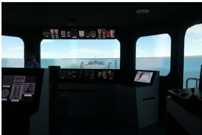
Fig.4 Numerical Offshore Tank