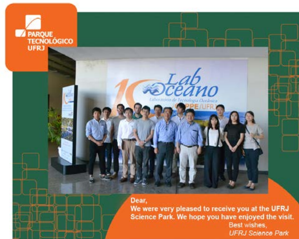
Fig.11 UFRJ Science Park

UFRJ (リオデジャネイロ連邦大学) Fudao 島キャンパスには、2003 年より、13 の大企業、8 の中小企業、26 のスタートアップ、7 つのラボを有するサイエンスパークが存在する。ここでは、イノベーションとアントレプレナーシップを目的に、大学からの技術移転を進め、企業ファンドにより研究を進めるサイクルを実施している。見学のファシリティが整っており、説明者も雇用するなど、充実したサイエンスパークである。