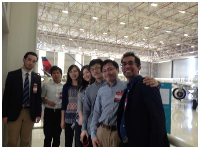
Fig.8 Embraer Aircraft Shipping area