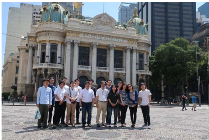
Fig.15 Rio De Janeiro municipal theater

帰国日である 25 日は、夕刻の出発便までの時間を使い、リオデジネイロの町を訪れた。リオは、サンパウロに次ぐ第 2 の人口、経済規模を持つ。広大な海岸を持つ世界有数の美しい都市であり、カーニバルや 2016 年オリンピックでも知られる。治安の心配な地域も存在するが、過度に不安視せず、十分な配慮のもと、訪れることが推奨される。