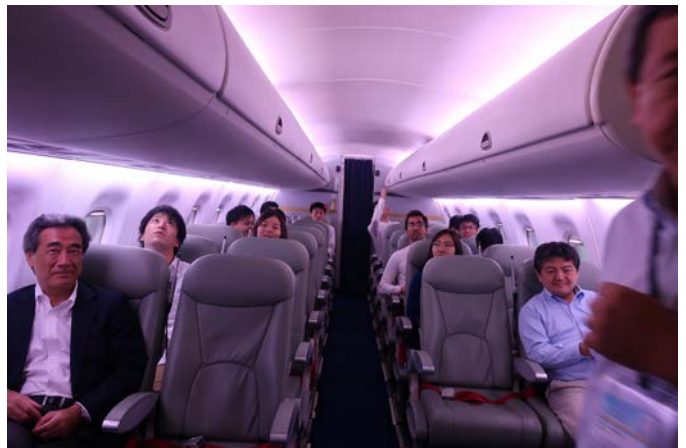
Fig.3 Aircraft Cabin Comfort Experiments