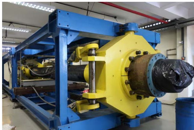
Fig.14 Pipe Bending Machine