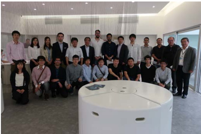
Fig.1 Group Photo at University Sao Paulo

Aircraft Cabin Comfort, Autonomous Underwater Vehicle, Numerical Offshore Tankに関する研究室を訪問し、研究設備見学と研究紹介を受けた。いずれも企業や政府との共同研究であり、実際の問題を取り扱っている。研究設備の規模の巨大さには学生、教員共に感嘆した。Aircraft Cabin ComfortはEmbraerとの共同研究でスタートし、現在ではBoeing等とも連携を行っている。Autonomous Underwater Vehicleは軍とも一部連携しているが、民間需要の研究を図っている。Numerical Offshore TankではPetrobrasとの関係がよく分かる。石油掘削に関連して海洋構造物の健全性を検討する巨大水槽も見学できた。