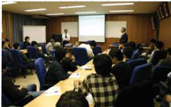
有信氏のご講演の様子

「工学」という言葉の語源に遡り、本来の意味である「専門職業」という認識が根付かず、「学問」の側面ばかりが重視される日本の問題点が指摘されました。これからの技術者に求められることとして、技術の悪用を防ぐシステムの構築、社会と一体化した技術の選択が挙げられました。質疑応答では、世界共通の機械工学士の資格作りや、科学者と技術者の位置づけに関して、活発な議論が行われました。