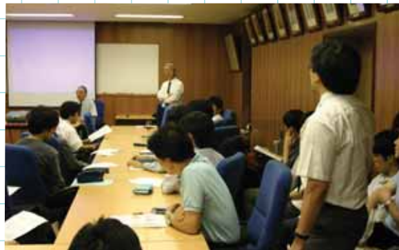
大橋先生に対する大学教員からの質疑