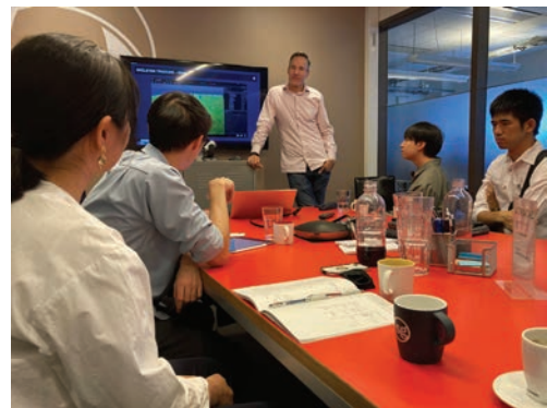
Fig. 3 Site Visit at Tracab