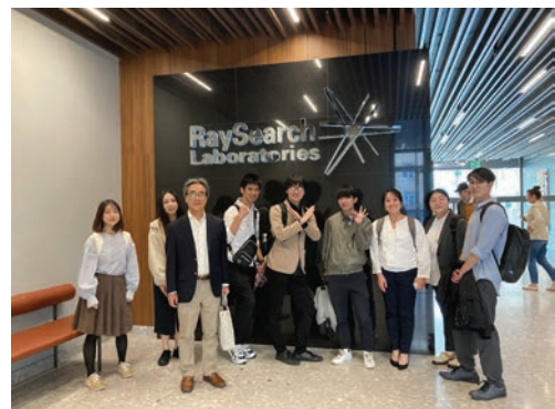
Fig. 4 Site Visit at RaySearch