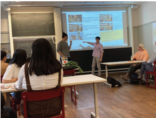
Fig. 1 Japanese class at KTH