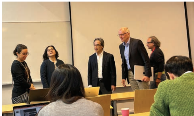
Fig. 5 Research Presentation at Aalto University

北欧の二つの大学と4つの企業を訪問でき、様々な分野の先進的な研究が実施されていること、加えて、様々な大学発ベンチャー、スタートアップが実際に活躍していることを実感した。先端研究と社会実装が一体となっており、研究者が生き生きとして、今後の進展が見えるようであった。また、KTH では意外にも日本人留学生が多くいるようで、Student Union のカフェテリアで慶応や早稲田からの留学生に声をかけられた。都市工学専攻からの留学生にも会い、GME による機械工学専攻の交換留学生 3 名とは交流を持って、WINGS の紹介にもなった。今回の訪問は、今後の研究やキャリアを考える上で大変参考になったものと信じている。現地では友好的で親切な対応を行っていただきました。改めて関係者の皆様に感謝いたします。