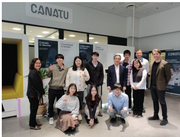
Fig. 8 Site Visit at Canatu