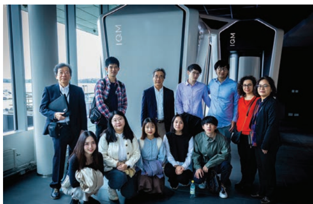
Fig. 7 Site Visit at IQM