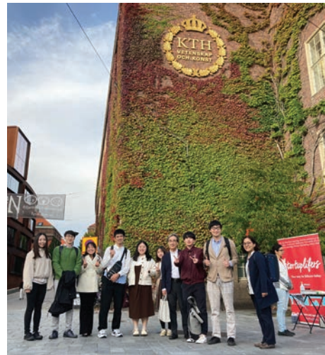
Fig. 2 KTH Royal Institute of Technology