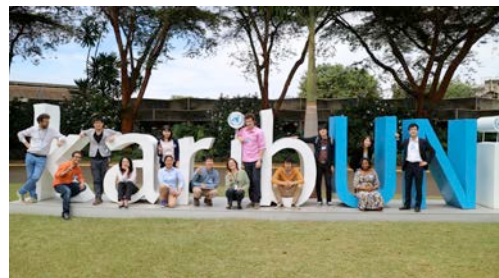
Fig.10. Meeting at UN-Habitat