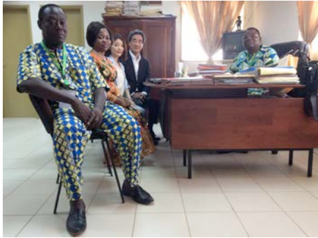
Fig.3 Dean of Engineering, UAC