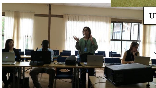
UN-HABITAT でのワークショップ