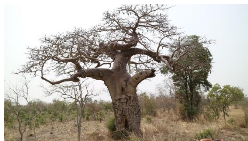
400年以上のバオバブ木

本WSの後半はベナンからケニアに移動し、アフリカ唯一である国連環境プログラム(UNEP)と都市プログラム(UN-HABITAT)を訪問した。国連での仕事内容、アフリカ諸国の問題、国連と大学との関わり方などを学び、さらにJob opportunity、国連職員のプロフィール、国連のグローバルリーダーになるまでの経験など様々な視点から議論が出来た。