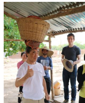
頭に荷物を載せる初体験