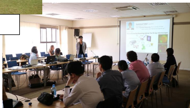
UN-HABITAT : 学生発表

アカデミアからアフリカ農村部での実生活まで様々な面で勉強が出来て本当にかげがえのない勉強期間でした。アフリカに対する思い込みや優先感などはこれで少し変わることを期待している。問題が山積しているアフリカ諸国の中で、それでも国民が自分の幸せを見つけようと懸命に努力しているアフリカの人々、一方、生活環境は極めて恵まれており、それでもなお何か探し続ける日本との交流はお互いの利益になるのは違いない。