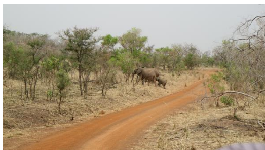
自然の中の像の家族

さらに、ベナンと隣国のブルキナファソが共同保有しているペンジャリ国立公園で生物多様性に関する課外活動を行った。東京ドームの約800個の敷地面積に様々な動物が自然環境の中で暮らしており、400年以上生きているバオバブ木など様々な生き物が広大なアフリカの地で共生している姿は印象的であった。