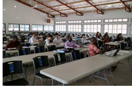
Fig.2. Discussion with UAC students