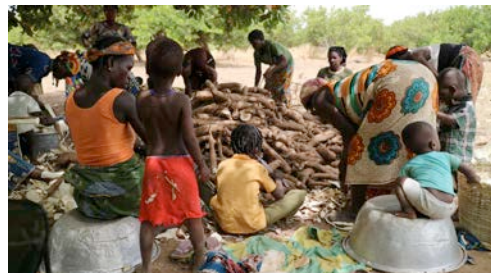
Fig.6. Farming activities in rural life