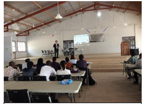
UAC での研究ワークショップ

Rural life : Rural farmer's problems and perspectives