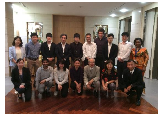
日本大使館での集合写真

ベナン滞在1日目は、アフリカで唯一の日本語学校である「たけし日本語学校で日本語学校」へ訪問し、ボランティアで日本語教室の先生を行っている日本人教師に日本語学校の歴史や現地での生活の実態を伺った。