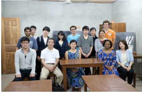
Fig.1. Visiting Japanese school in Benin