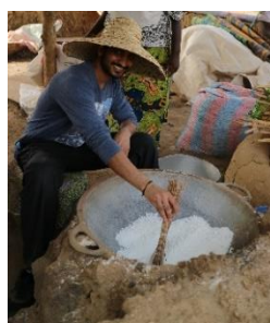
タピオカの仕込み