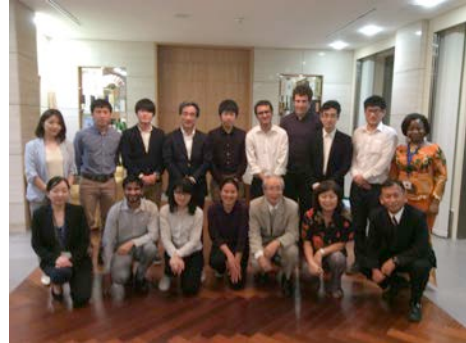
Fig.4 Japanese Embassy in Benin