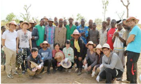
Fig.5. Rural life with Benin farmers