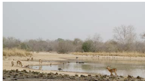
Fig.8. Pandjari National Park