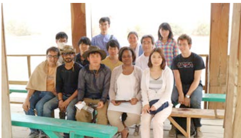
Fig.7. Biodiversity study at Pandjari