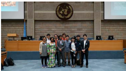
Fig.9. Meeting at UNEP